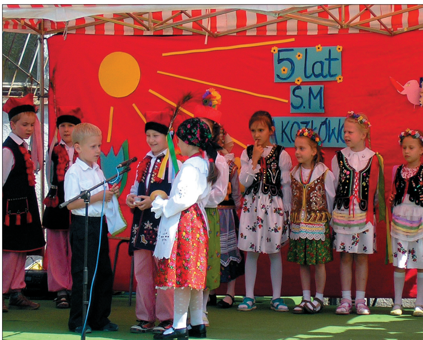
"Wesele Krakowskie" w wykonaniu dzieci z przedszkola nr 36.