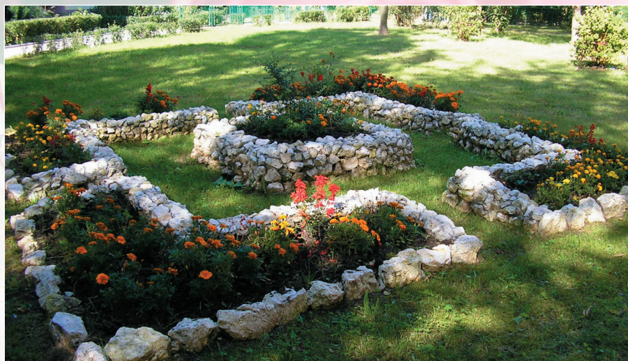
Skalniak przy ulicy Okólnej 8-10.