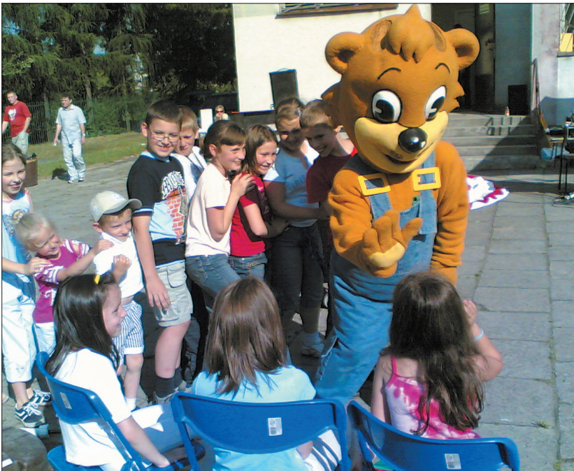
Gościem specjalnym i atrakcją nie tylko dla dzieci był KUBUŚ