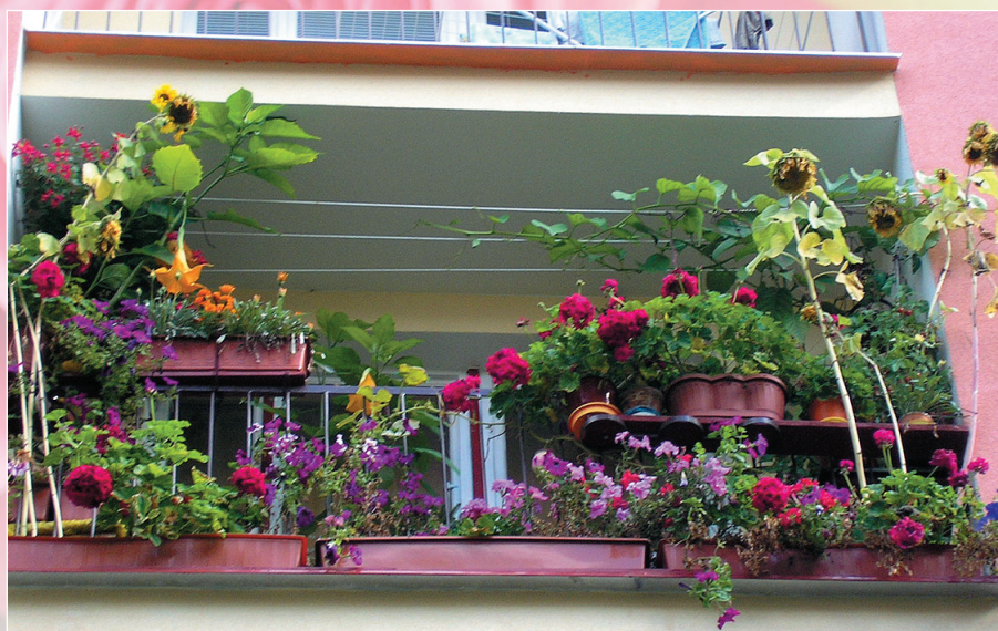
agrodzony balkon w 2005 roku przy ulicy Spółdzielców 8