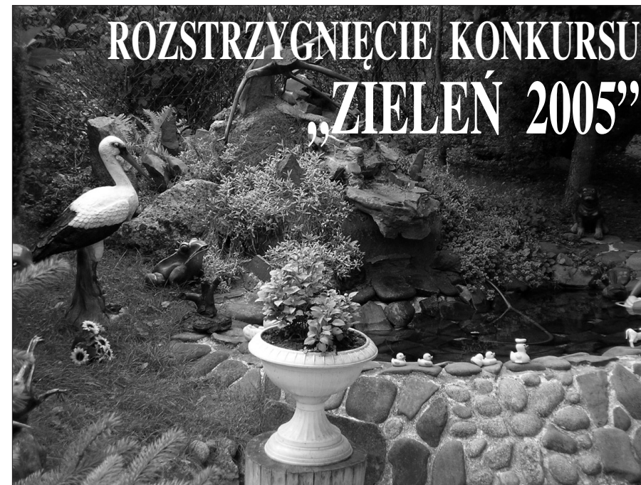
Ogródek z oczkiem wodnym

NR (14) 3/2005 r. Kwartalnik Spółdzielni Mieszkaniowej „Na Kozłowce”