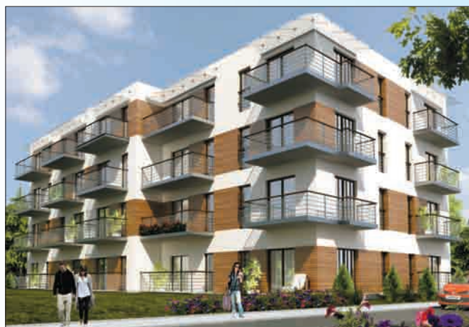
A tak będzie wyglądał budynek za pół roku

Nowy dom posiada bardzo dogodne położenie przy zbiegu ulic Wielkiej i Nowosądeckiej, umożliwiające łatwy dostęp do szybkiego tramwaju i autobusu. Zlokalizowane na sąsiednich działkach budynki skutecznie odgradzają go od szumu głównych ciągów komunikacyjnych. Dobra infrastruktura osiedla posiadającego żłobek, dwa przedszkola, dwie szkoły, place zabaw, sklepy, placówki bankowe, pocztowe i przychodnie lekarskie powodują, że przyszli mieszkańcy będą mogli załatwić wszystkie sprawy w miejscu swojego zamieszkania. Kameralny budynek zawierający zaledwie 20 małych mieszkań został zaprojektowany przez renomowaną Autorską Agencję Projektową A4 z Nowego Sącza. Dla każdego mieszkania przewidziane jest miejsce parkingowe w wielostanowiskowym garażu znajdującym się w jego piwnicy. Każdy lokal wyposażony jest w przestronny balkon i dla każdego przewidziane jest komórka lokatorska. Dla zwierząt