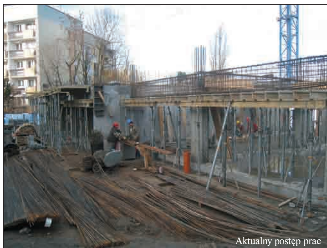
Aktualny postęp prac

Miło nam jest Państwa poinformować, że prace na budowie nowego bloku postępują bardzo dynamicznie. Zrealizowany został już w całości garaż wielostanowiskowy zlokalizowany w piwnicy. Gotowy jest też parter i aktualnie trwają prace na pierwszym piętrze bloku przy ul. Niedzickiej 2a. Jeżeli utrzyma się pogoda i aktualne temperatury, to istnieje duże prawdopodobieństwo, że do końca stycznia 2012 zakończony zostanie stan surowy obiektu. Tym samym nie ma żadnego zagrożenia dla terminowej realizacji obiektu ustalonej w umowie z Firmą INTERBUD na sierpień 2012r. Szybko postępuje również proces sprzedaży mieszkań. Na dwa dziesięcia dostępnych lokali sprzedanych zostało już dwanaście. Oznacza to więc, że 60% mieszkań znalazło już swoich nabywców. Do sprzedaży pozostało zaledwie osiem mieszkań, które prezentujemy na następnej stronie.